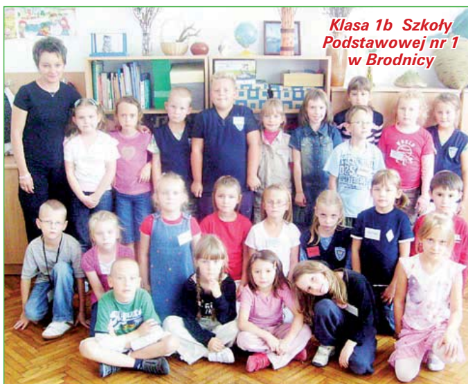
Klasa 1b Szkoły Podstawowej nr 1 w Brodnicy

pomocy dydaktycznych do miejsc zabaw w szkole i na urządzenie szkolnego placu zabaw. Intencją programu jest stworzenie w szkołach warunków do aktywności ruchowej, porównywalnych ze standardami wychowania przedszkolnego (zm)