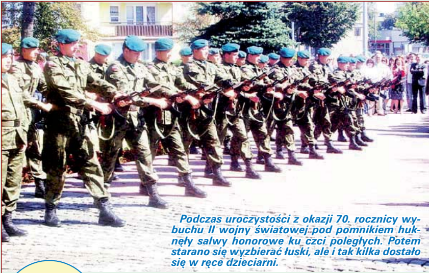
Podczas uroczystości z okazji 70. rocznicy wybuchu II wojny światowej pod pomnikiem huknęły salwy honorowe ku czci poległych. Potem starano się wybierać tuski, ale i tak kilka dostało się w ręce dzieciarni.