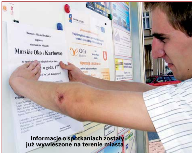
Informacje o spotkaniach zostały już wywieszone na terenie miasta

Nazwa Osiedla: Michałowo. Ulice na obszarze osiedla: Boczna, Bolesława Jastrzębskiego, Feliksa Smoczyńskiego, Jana Janaszka, Krańcowa, Lidz-