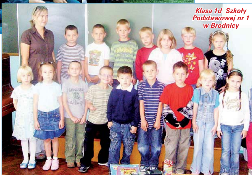
Klasa 1d Szkoły Podstawowej nr 1 w Brodnicy

Uczniów ze Szkoły Podstawowej nr 4 łatwo można rozpoznać za sprawą kolorowych czapek.