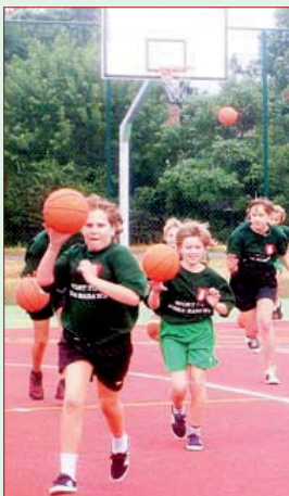
To była radość, szaleństwo, prawdziwa euforia. Na otwarciu Orlika przy SP nr 4 zebrało się sporo dorosłych, ale do nich należało tylko kilkanaście minut oficjalnej ceremonii. Tak naprawdę świętowała i cieszyła się młodzież. W niektórych wstał jakby nowy duch.