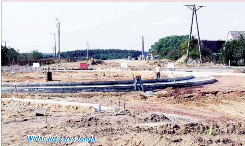
Widać już zarys ronda