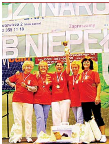
Brodnicka ekipa była w pełni zadowolona z występu

Termin i miejsce zebrań: 25.09.2009 r. (piątek), godz. 17.00, Brodnicki Dom Kultury, ul. Przykop 43.