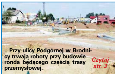
Przy ulicy Podgórnego w Brodnicy trwają roboty przy budowie ronda będącego częścią trasy przemysłowej.