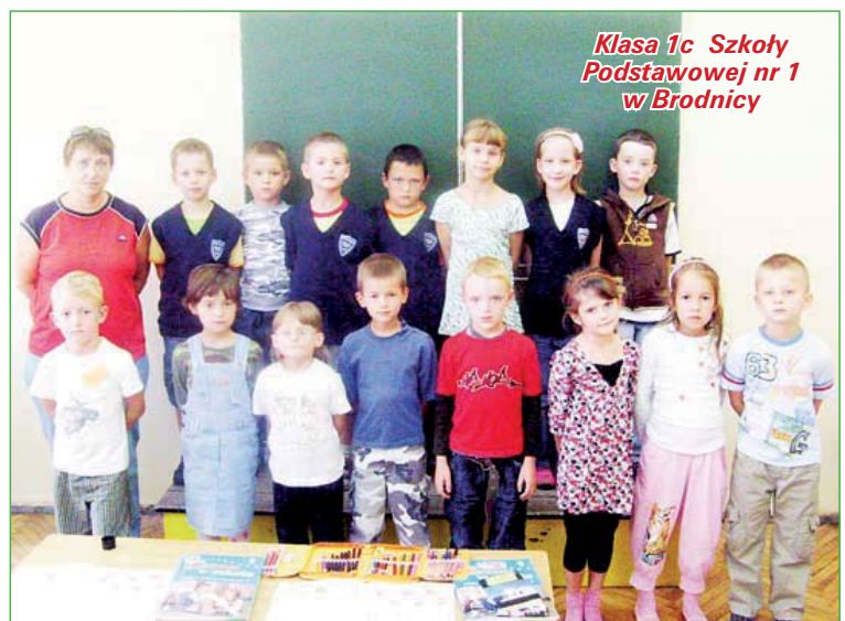
Klasa 1c Szkoły Podstawowej nr 1 w Brodnicy