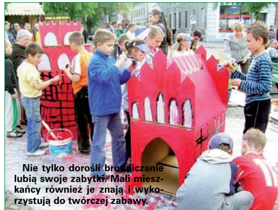
Nie tylko dorośli brodnickanie lubią swoje zabytki. Małomieszkańcy również je znają i wykorzystują do twórczej zabawy.