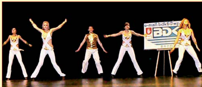
Zespół Uniq był kiedyś trzecim zespołem tańca disco-dance w Polsce. Teraz wraca do dawnej świetności.

Locking, to pokazowy styl tańca należąca do grupy Funk Styles i tańców ulicznych (street dance), będący „protoplastą” tańca hip-hop. W skrócie, polega on na szybkich