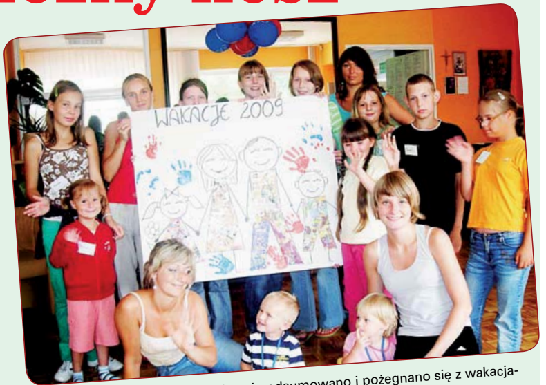
W Warsztatach Terapii Zajęciowej podsumowano i pożegnano się z wakacjami. Uczyniono to jak widać w bardzo dobrych nastrojach.