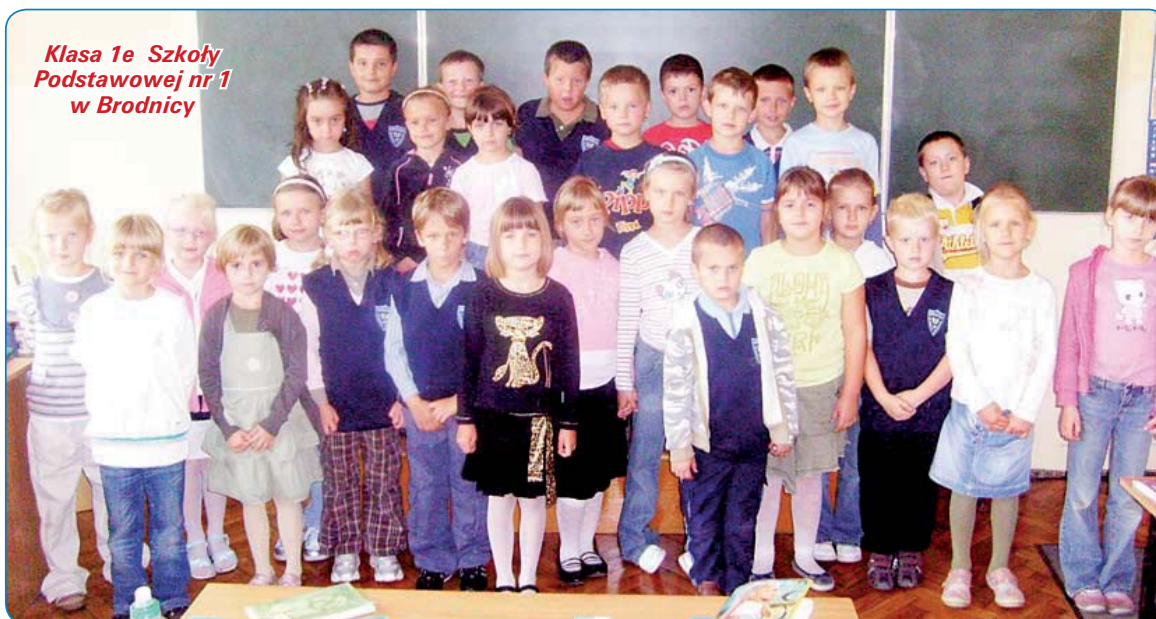
Klasa 1e Szkoły Podstawowej nr 1 w Brodnicy