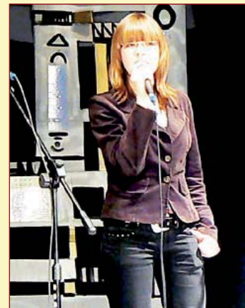
W Brodnickim Domu Kultury każdy może spróbować swych sił w roli wokalisty lub wokalistki

nienie, przygotowanie repertuaru, który uczestnicy prezentują w przeglądach i konkursach.