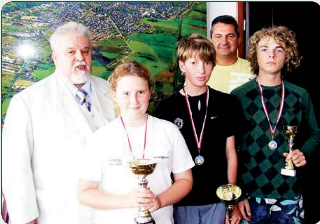
Brodniccy żeglarze pływają znakomicie i rozławiają miasto. Swymi ostatnimi osiągnięciami pochwalił się burmistrzowi. Podczas regat w Zninie byli bezkonkurencyjni. Jak tak dalej pójdzie to Brodnica stanie się bardziej znana od koncertu NIVEA – znanego sponsora Błękitnych Żagli.