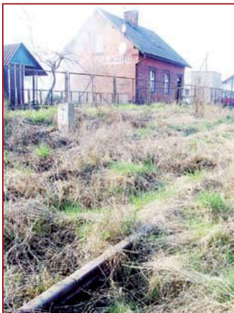
Nieczynna stacja kolejowa w Jajkowie. Pociągi tu już nie wrócą.